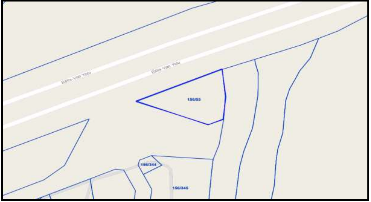
Eskiçami Mahallesi 156 Ada 55 Parselin Kadastro Durumu