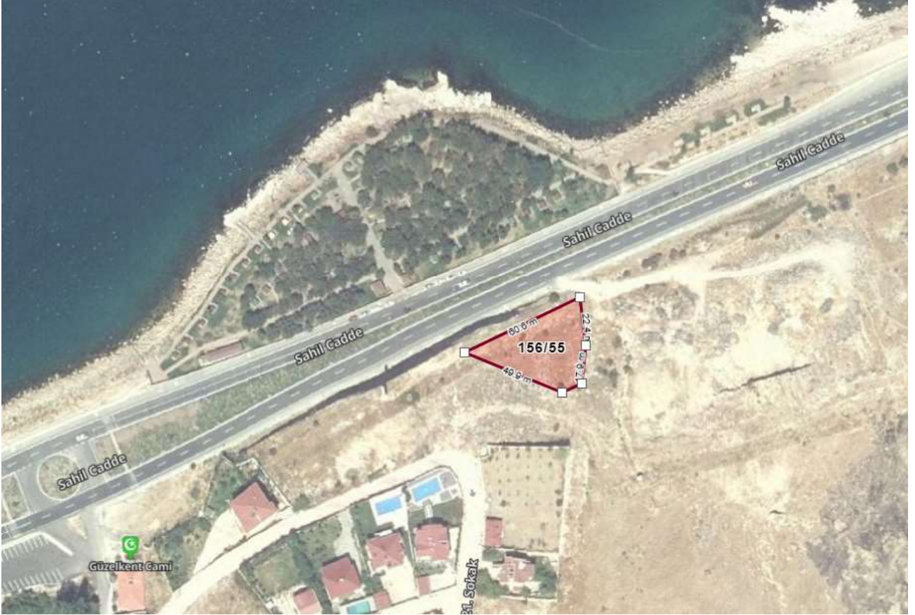
Eskiçami Mahallesi 156 Ada 55 Parselin Konumu

Taşınmaz çevresinde yapılaşma bulunmamakta olup meskûn mahalde ve belediye hizmetlerinden faydalanmakta olup tercihli ve gelişmekte olan bir konumdadır.